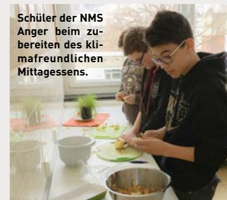
Schüler der NMS Anger beim zubereiten des klimafreundlichen Mittagessens.

Um den Müll beim Einkaufen zu reduzieren haben die SchülerInnen der VS Baierdorf selbstgestaltete Einkaufstaschen aus Baumwolle hergestellt. Auch hier wurde besprochen wie auch beim Einkauf auf das Klima geachtet werden kann.