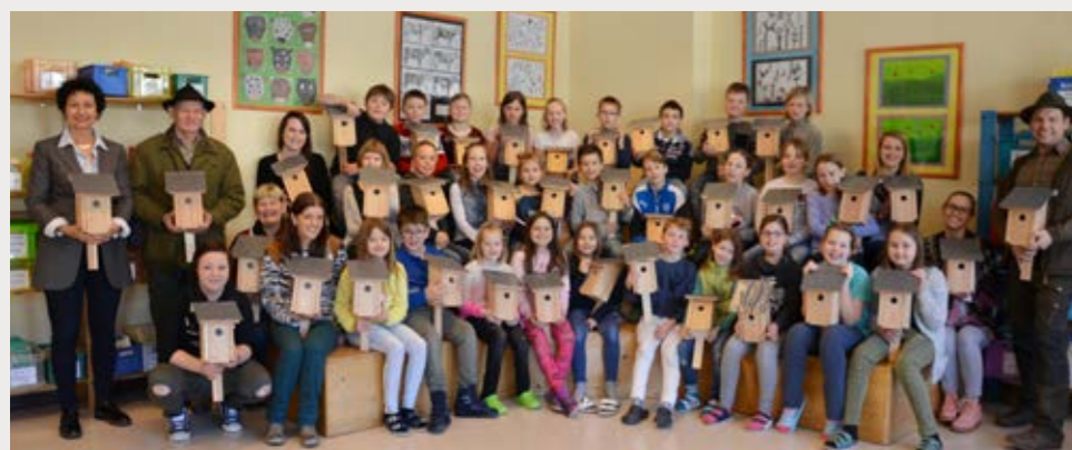
3. und 4. Klasse VS Anger mit den im Werkunterricht entstandenen Nistkästen.